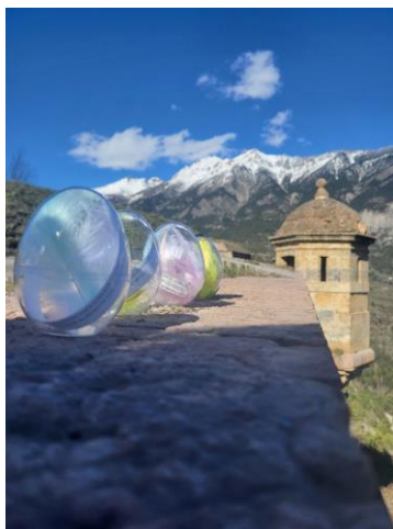
Œufs de Pâques vers l'échauguette