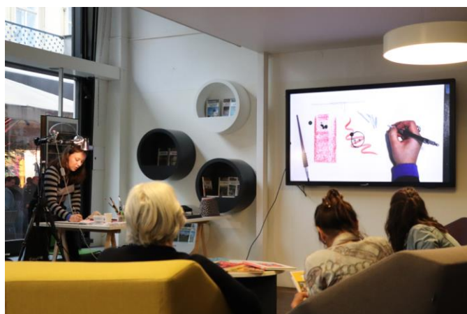
Performance de dessin en direct par Physalis © Physalis