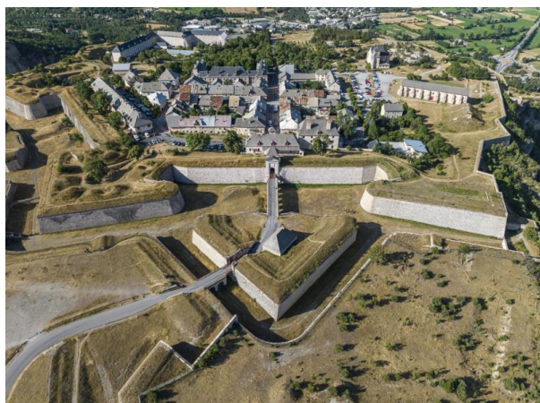
Le front nord