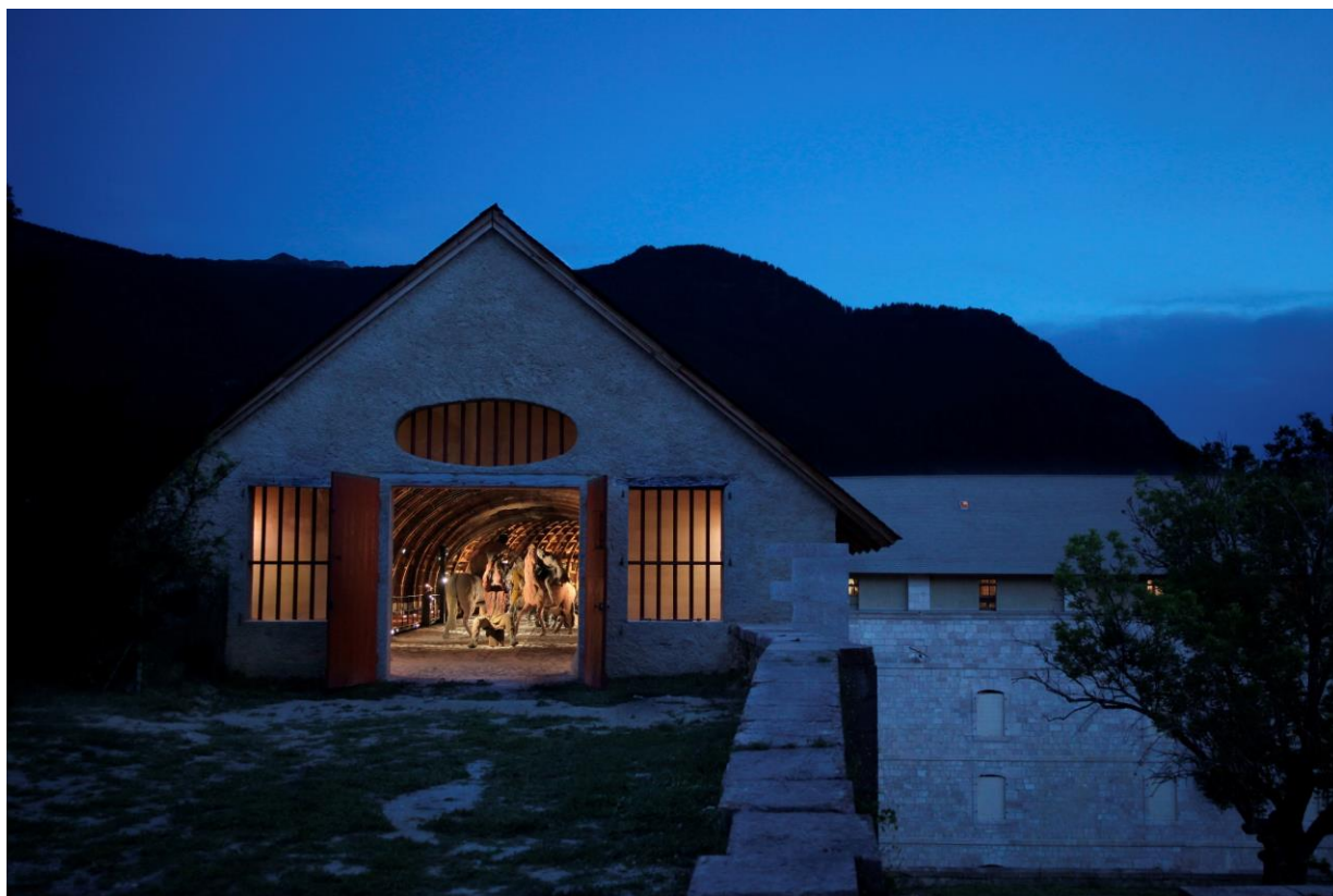
Place forte de Mont-Dauphin, caserne Rochambeau de nuit

En 2023, ce sont déjà plus de 6500 visiteurs qui sont venus admirer l'œuvre d'Ousmane Sow, dont 500 élèves des établissements scolaires du département.