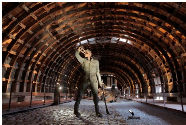
Clairon et charpente des combles © Little Bighorn à Mont-Dauphin, Olivier Guéneau - Centre des monuments nationaux