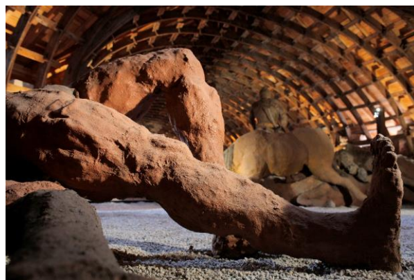
Place forte de Mont-Dauphin, caserne Rochambeau de nuit