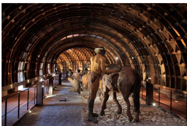
Vue de dos de la scène de la « Retraite d'un soldat » et charpente des combles