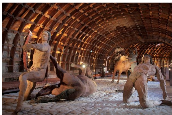
La riposte de Chief Gall et un Indien blessé ; à l'arrière-plan, Crazy Horse assailli © Little Bighorn à Mont-Dauphin, Olivier Guéneau - Centre des monuments