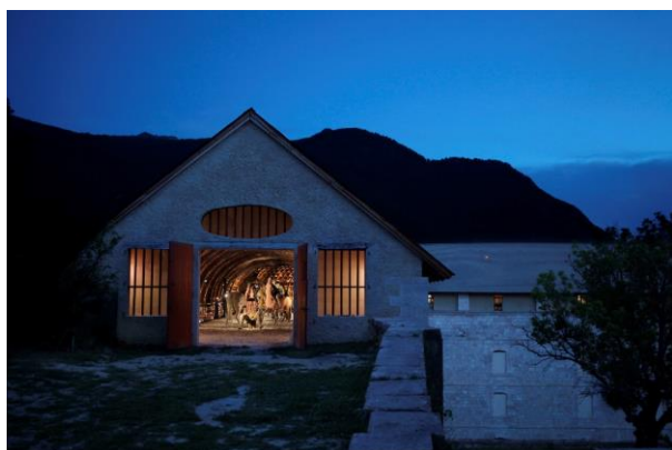
Place forte de Mont-Dauphin, caserne Rochambeau de nuit © Little Bighorn à Mont-Dauphin, Olivier Guéneau - Centre des monuments