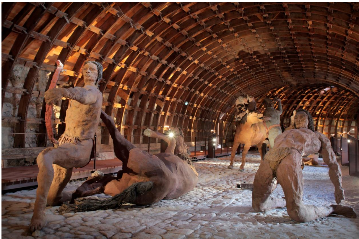
La riposte de Chief Gall et un Indien blessé ; à l'arrière-plan, Crazy Horse assailli © Olivier Guéneau - Centre des monuments nationaux

Au village fortifié de Mont-Dauphin, l'exposition sculpturale « Little Bighorn, par Ousmane Sow » est gratuite tous les premiers dimanches du mois de novembre à mars !